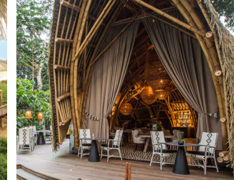
SÃO TOMÉ & PRÍNCIPE