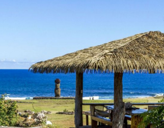
ILE DE PÂQUES